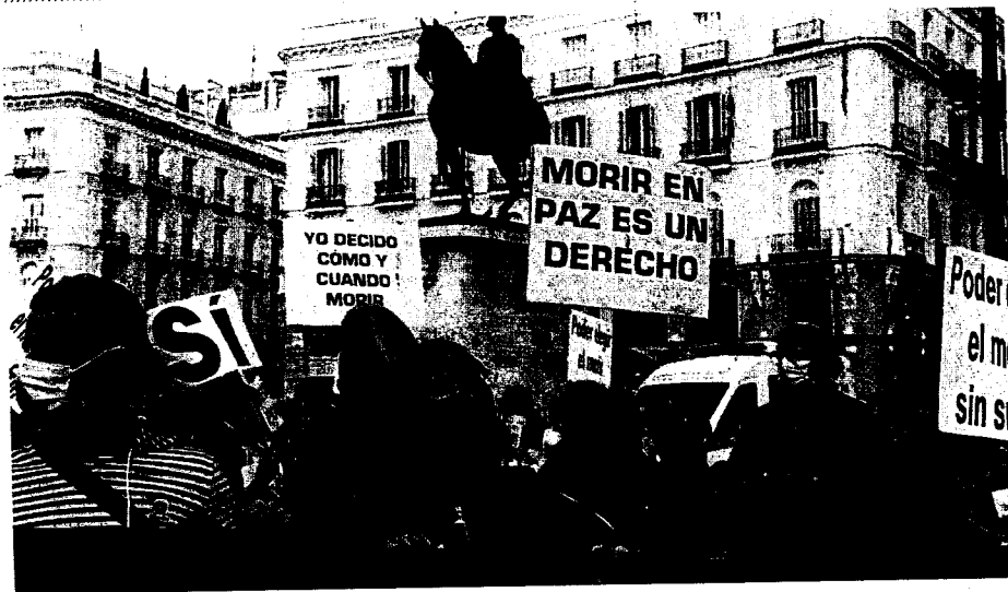
Concentración de Derecho a Morir Dignamente en la Puerta del Sol, en Madrid.

— El Constitucional estudiará la reforma del Poder Judicial y la ley de eutanasia tras los recursos de PP y Vox